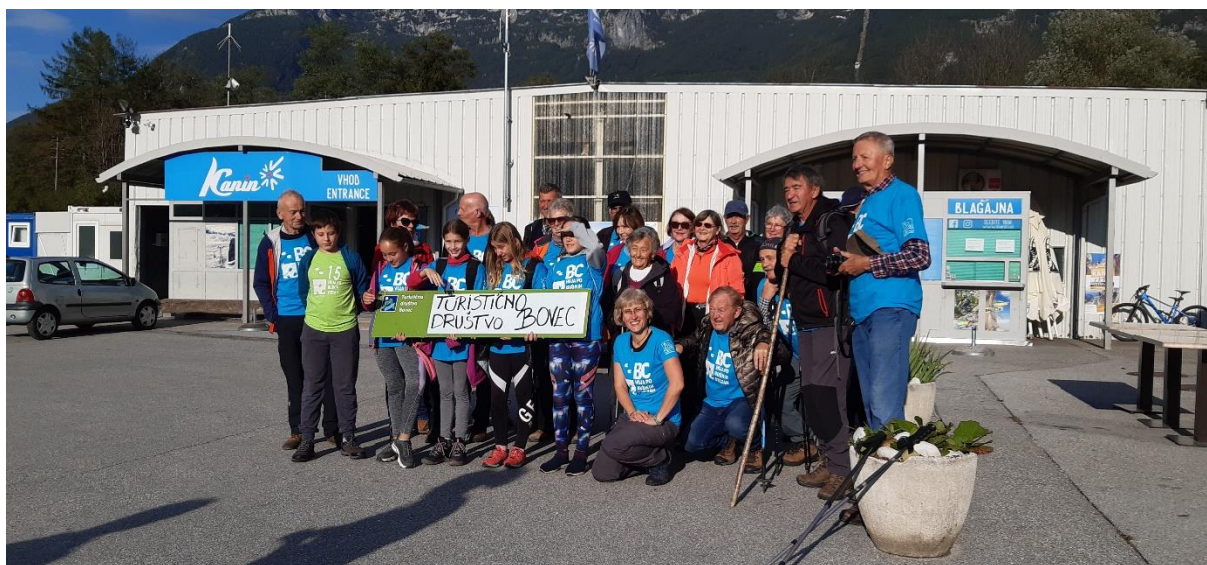
5 Mi na 18. Hoji po buških stezah