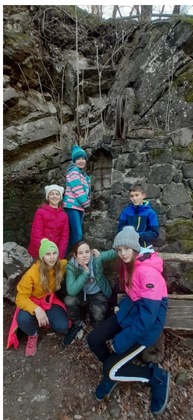
4 Mi pri vojaškem odprtem muzeju